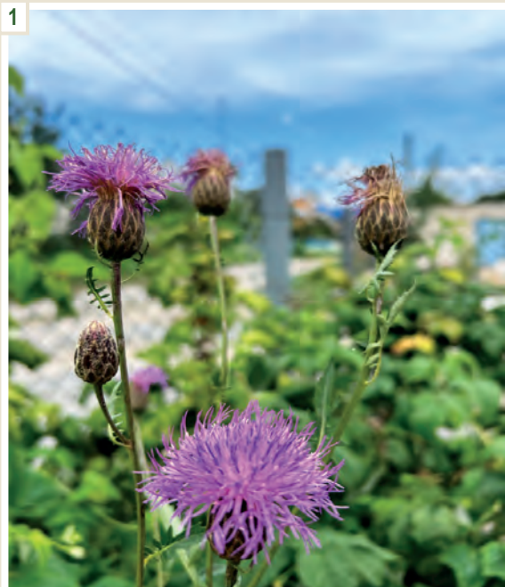
Рис. 1. Серпій увінчаний ( Serratula coronata L.), вирощений на дослідних ділянках (Тернопільська область).

Макроскопічні ознаки (рис. 2). За зовнішніми ознаками кореневище Serratula coronata L. коротке, товсте, від нього відходять численні тонкі, циліндричні додаткові корені. За будовою це горизонтальне кореневище, від якого утворені вертикальні або косо спрямовані додаткові корені. Кореневище за морфологічною будовою коротке, дерев'янисте, вертикальне або косо, діаметром до 2–4 см, на верхній частині помітні рубці від відмерлих стебел. Додаткові корені галузисті, шнуроподібні, численні,