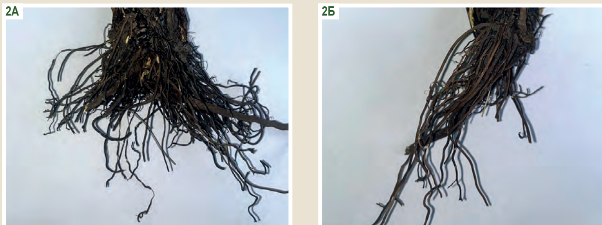
Рис. 2. Зовнішній вигляд висушеної сировини підземних органів Serratula coronata L. А: кореневище з коренями; Б: додаткові корені.